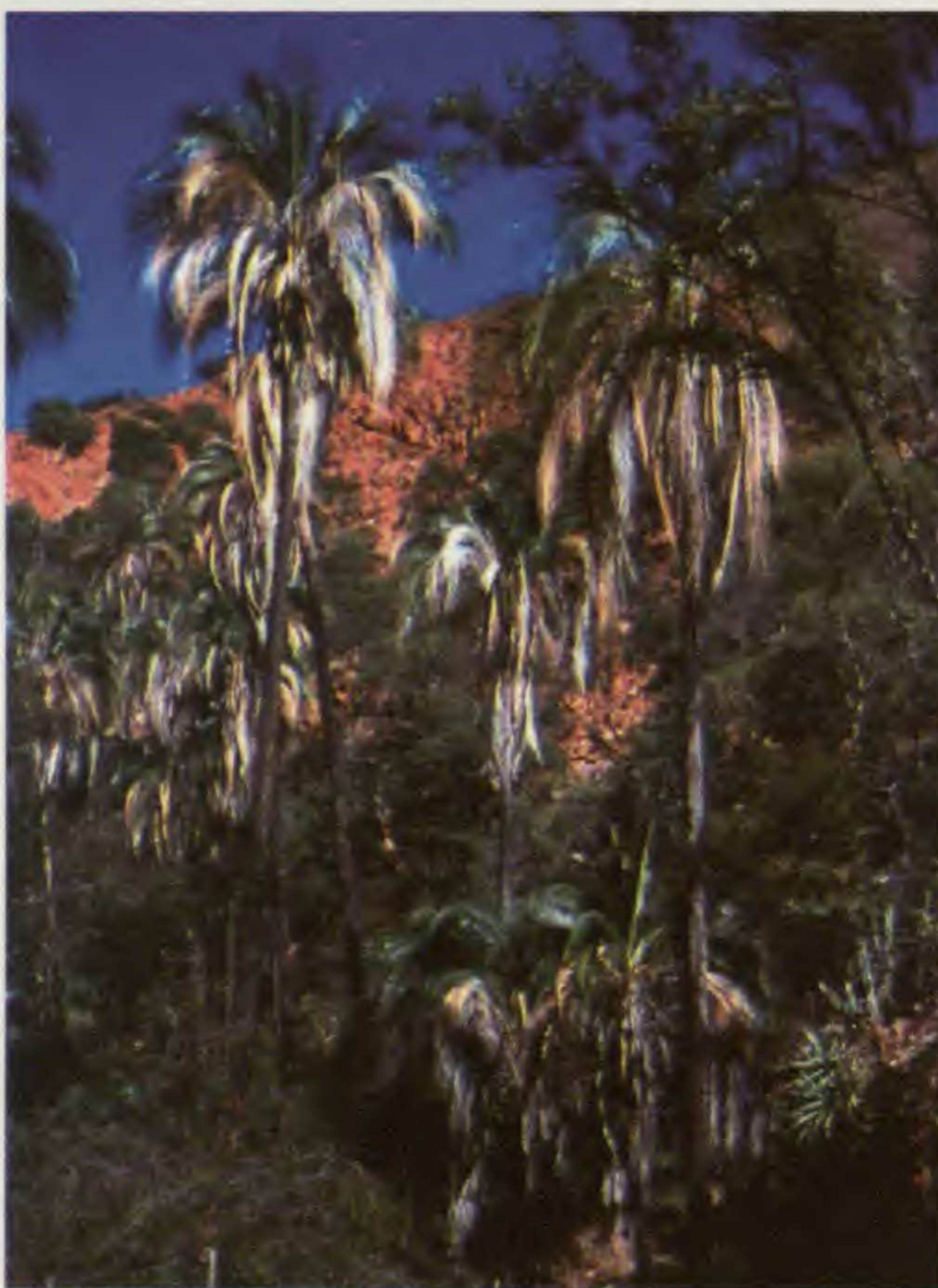
Fig. 1. Individuos de la especie endémica Parajubaea torallyi en la Serranía de Mandinga (departamento de Chuquisaca, Bolivia).